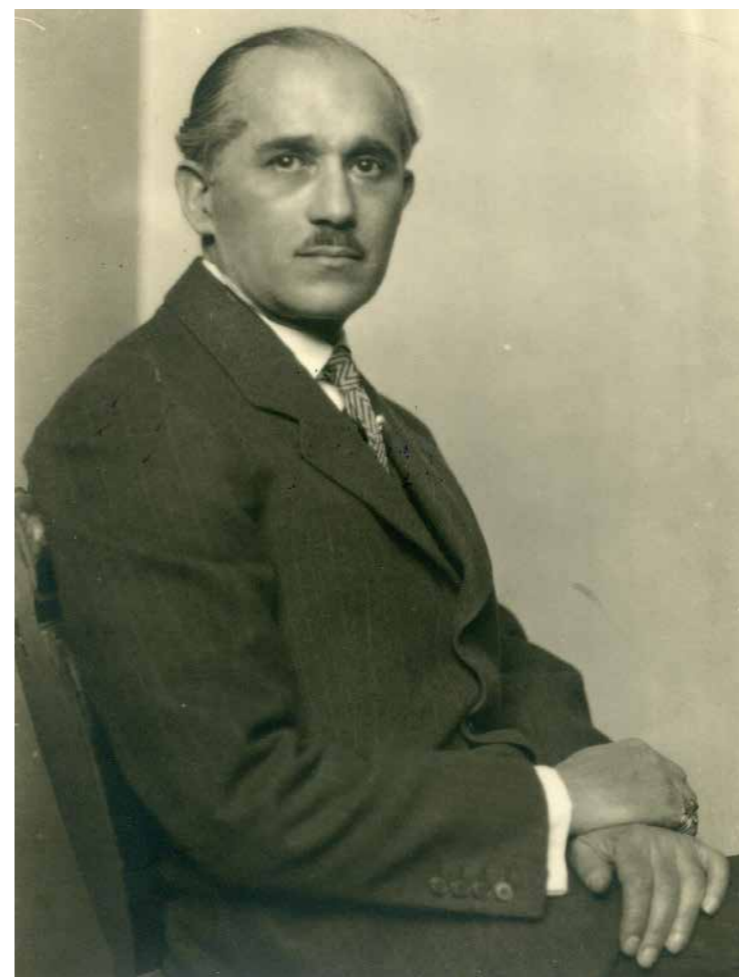
Géza Maróti en 1940