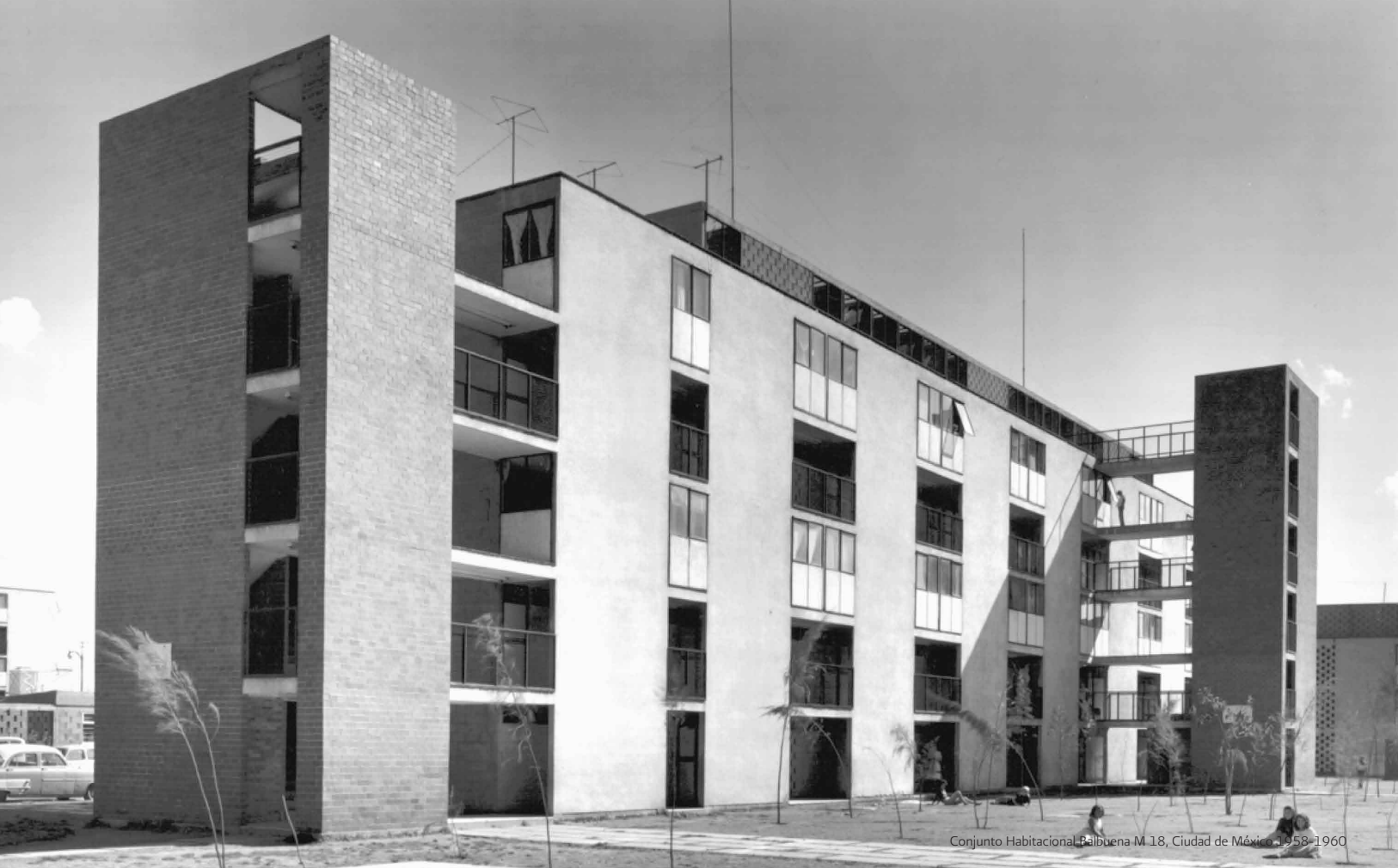
Conjunto Habitacional Balbuena M.18, Ciudad de México, 1958-1960

Encontraremos su casa en Tlalpan (1965), que marcara en su proceso creativo un nuevo enfoque, que mantuvo en evolución permanente en lo arquitectónico y lo académico, además de las casas del Desierto de los Leones (1985), Cuadrante de San Francisco, Coyoacán (1985-1986) y su estudio en Naranjatitla (1991), siendo ésta su última obra construida. Fallece en la ciudad de México en 2004.