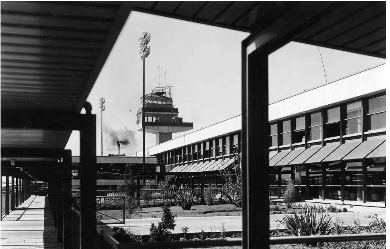
Aeropuerto central de la Ciudad de México. 1949-1954