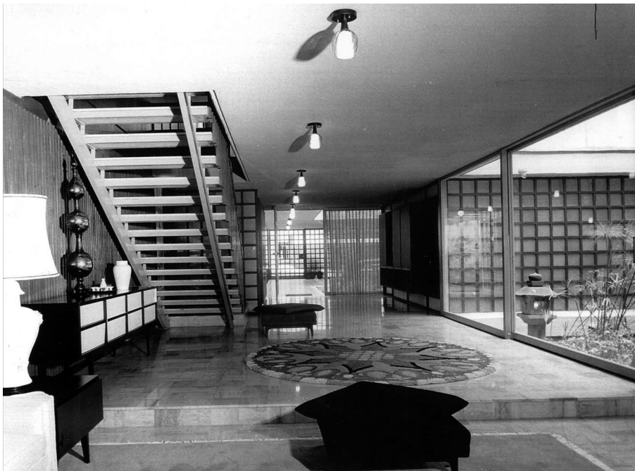
Casa Rojina, Jardines del Pedregal de San Ángel. David Cymet.