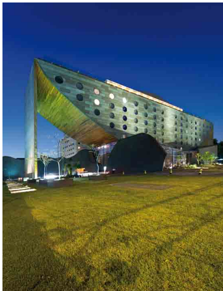
Hotel Unique. Arquitecto: Ruy Ohtake.

Los visitantes podrán apreciar cerca de cuarenta obras en ochenta láminas, mostrando los diseños de estos arquitectos, sin realzar la nacionalidad de cada uno, justo para hacer de esta muestra, una conjunción de culturas y necesidades compartidas.