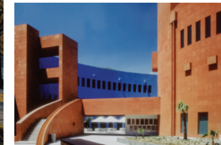
Legorreta + Legorreta, Escuela de Graduados en Administración Pública y Política Pública, EGAP ITSM, Monterrey, acceso, 2007.