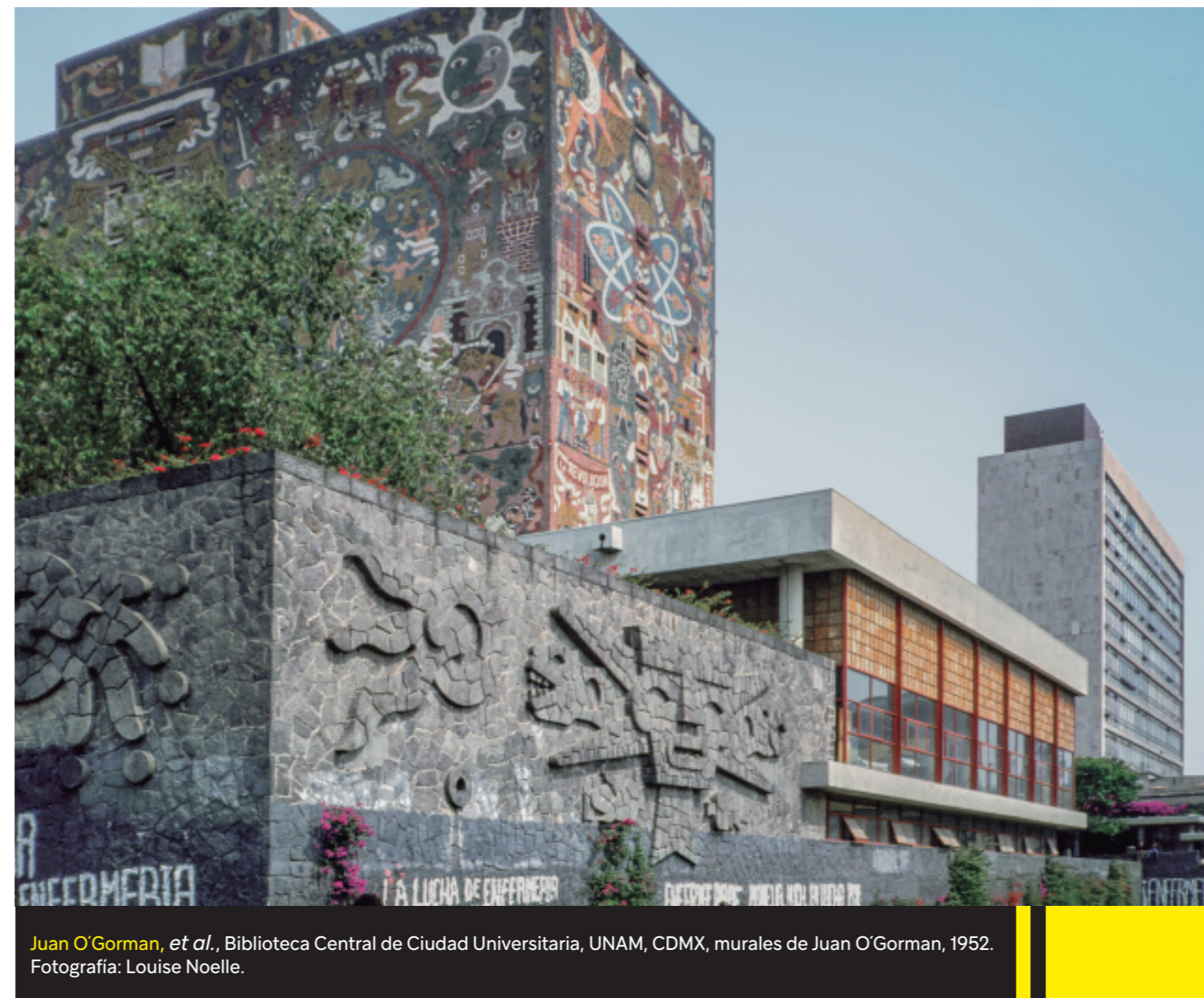
Juan O’Gorman, et al., Biblioteca Central de Ciudad Universitaria, UNAM, CDMX, murales de Juan O’Gorman, 1952.

Juan O’Gorman, Conferencia sustentada en la Sociedad de Arquitectos Mexicanos, 1933, reproducida en Pláticas sobre arquitectura , 1933, SAM, México, 1934.