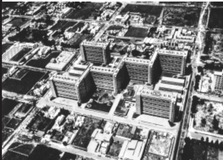
Mario Pani, Conjunto Urbano Presidente Alemán, vista aérea, CDMX, 1949.

Dirección de Arquitectura y Conservación del Patrimonio Artístico Inmueble